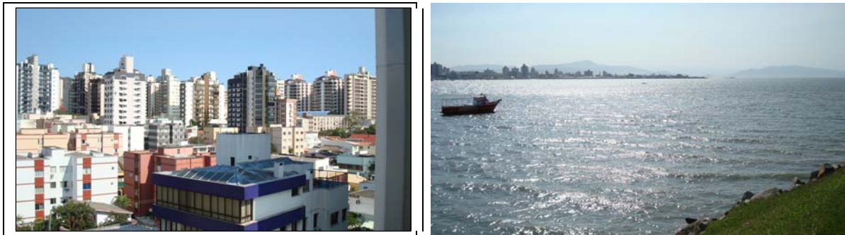
Figuras 3 e 4: Área central de Florianópolis e paisagem natural.

multiplicados pelo número de hectares de suas Áreas correspondentes e resultaram em um número total de habitantes por Área. A soma dos totais de todas as Áreas indicou um número total de habitantes para toda a Ilha, resultante dos parâmetros de ocupação do Plano Diretor. Assim, a população-residente (fixa e turística) estimada nos balneários da Ilha para alta temporada pode chegar aos 788.317 hab. Em relação à capacidade das praias, verificou-se que a população total chegará quase ao dobro daquela (402.376 hab), resultante dos índices de ocupação (já elevada) das praias. Constatou-se também que o Plano Diretor vigente permite uma ocupação altamente preocupante do território municipal, que alcança os valores de saturação da capacidade das praias, e ainda supera a população fixa e turística estimada pela presente pesquisa para a temporada do ano 2020 (SQUERA, 2006).